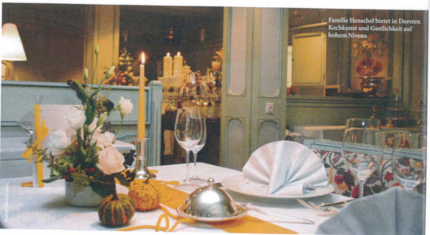
Familie Henschel bietet in Dorsten Kochkunst und Gastlichkeit auf hohem Niveau